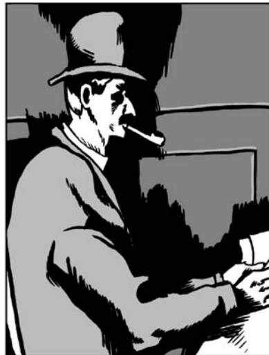
D'après Paul Cézanne: Les Joueurs de cartes