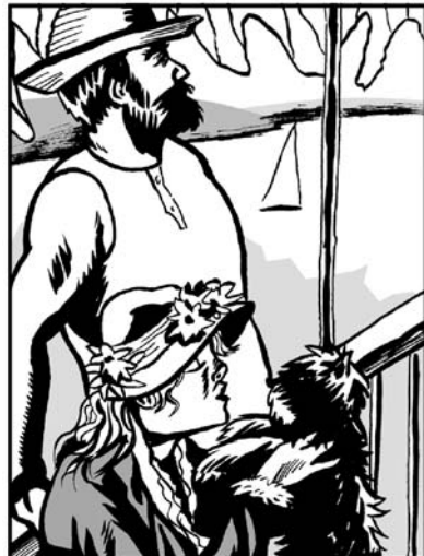
D'après Auguste Renoir: Le Déjeuner des canotiers