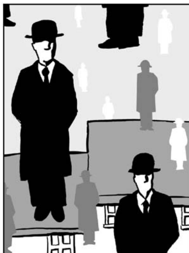
D'après René Magritte: Golconde